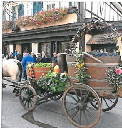
Während der letzte Erntewagen über den Erntedankumzug rollt kann man auch ein Gläschen Wein genießen.